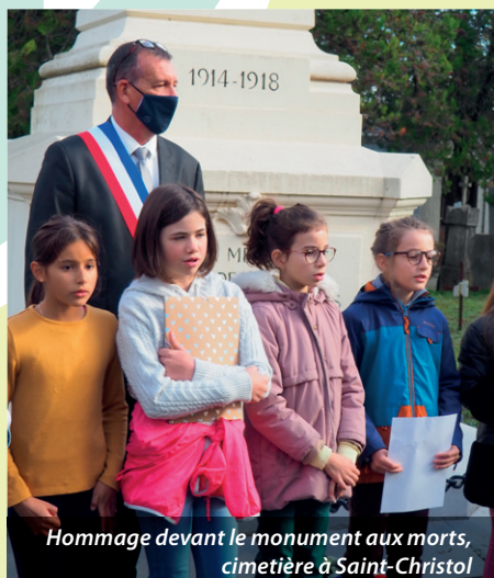
Hommage devant le monument aux morts, cimetière à Saint-Christol