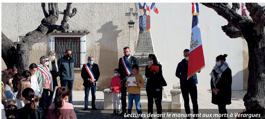
Lectures devant le monument aux morts à Vêrargues

Ne pas oublier ceux qui ne sont plus là, commémorer l'histoire de notre pays, un premier pas vers la citoyenneté.