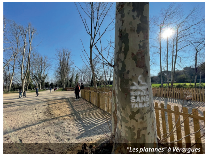
"Les platanes" à Vérargues

Nous remercions dès à présent l'ensemble de nos concitoyens pour leur participation et le respect de ces mesures.