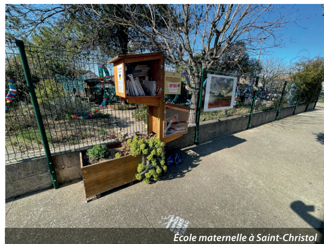
École maternelle à Saint-Christol